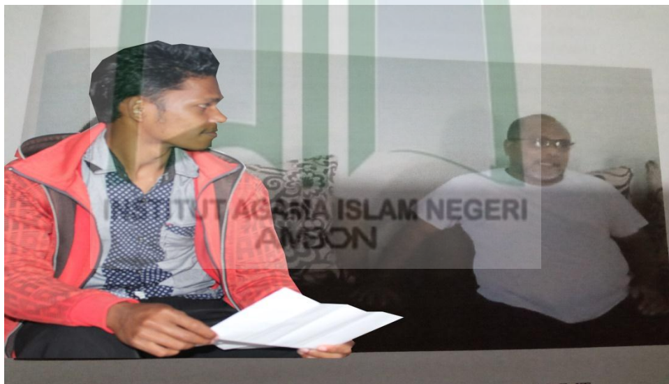
Gambar 1. Peneliti melakukan interviu bersama pak RT