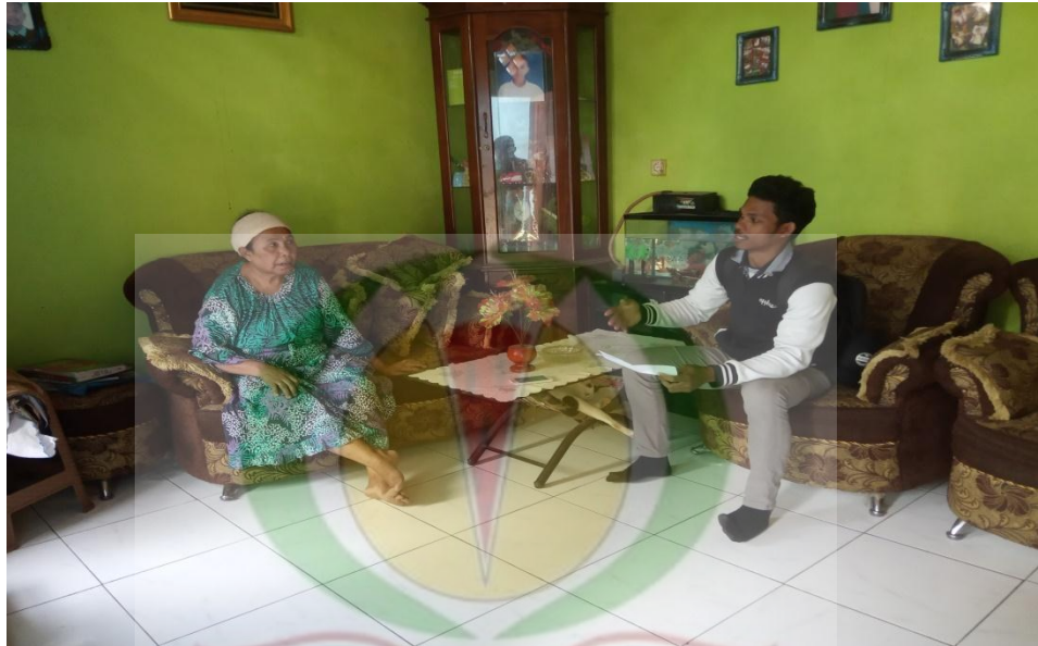
Gambar 3. Peneliti melakukan interviu bersama Ibu Cih