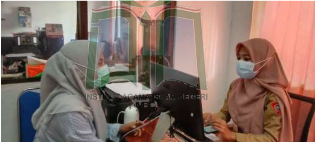
Gambar 2. Peneliti Sedang Wawancara Informan