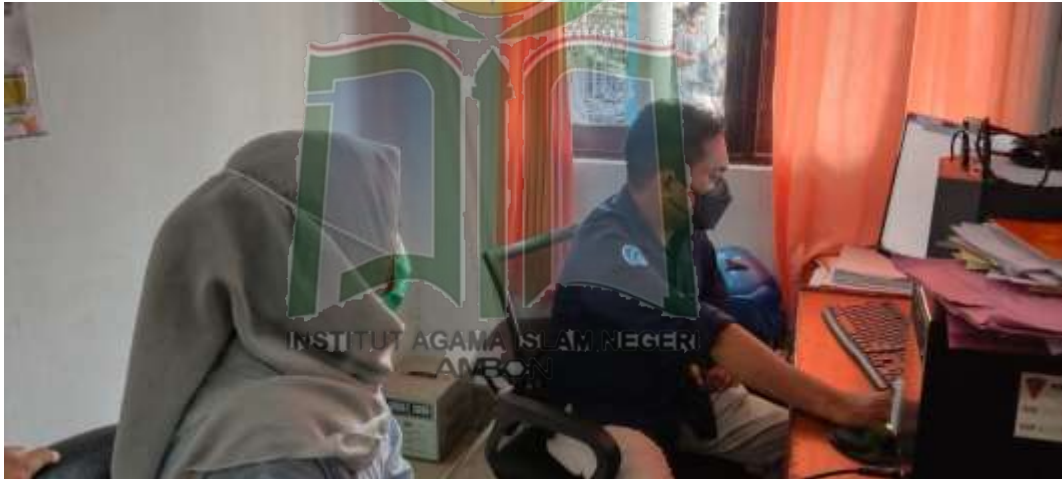
Gambar 4. Peneliti Sedang Wawancara Informan