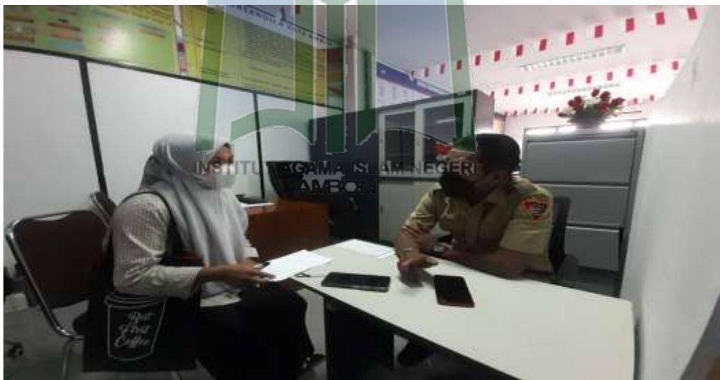
Gambar 8. Peneliti Sedang Wawancara Instrumen