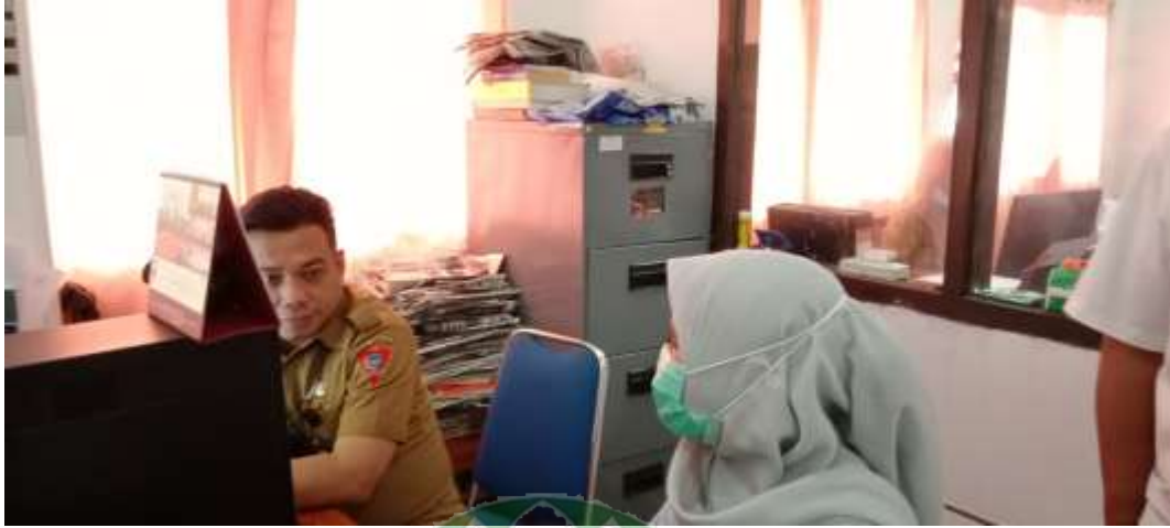
Gambar 3. Peneliti Sedang Wawancara Informan