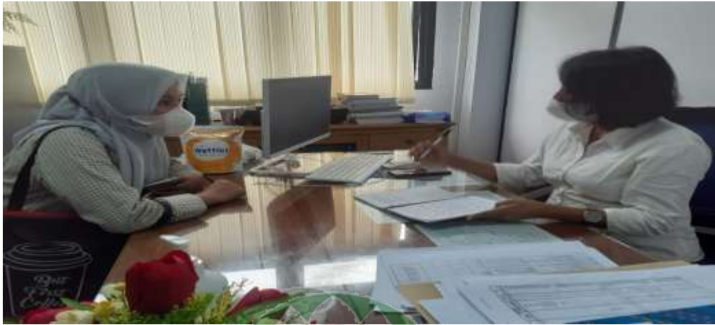
Gambar 5 Peneliti Sedang Wawancara Informan