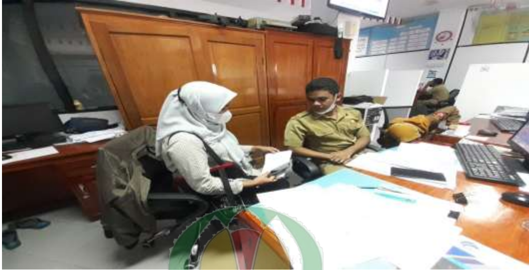
Gambar 7. Peneliti Sedang Wawancara Instrumen