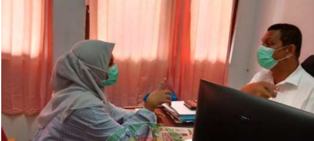
Gambar 1. Peneliti Sedang Wawancara Informan