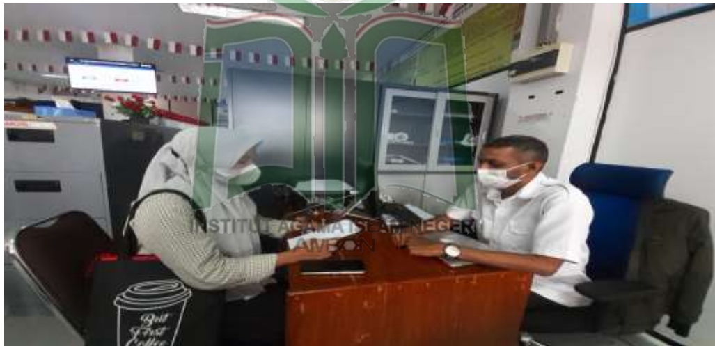
Gambar 6. Peneliti Sedang Wawancara Informan