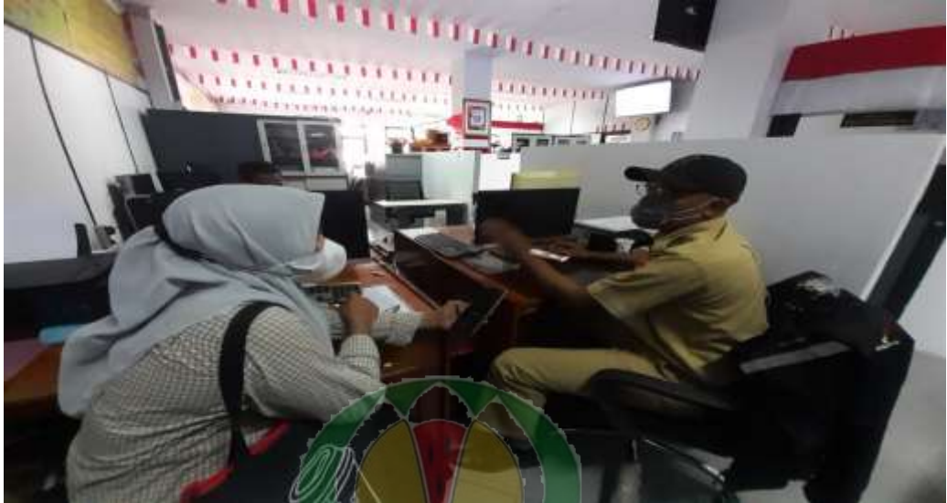
Gambar 9. Peneliti Sedang Wawancara Instrumen