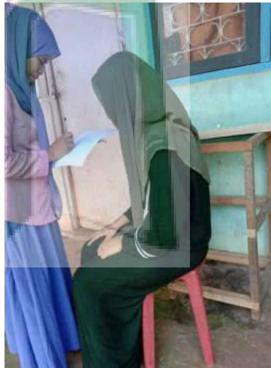
Foto 8. wawancara dengan