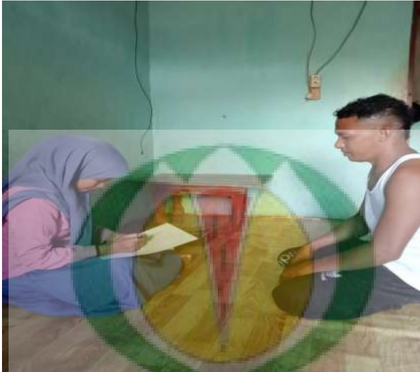
Foto 6. wawancara dengan masyarakat, ais