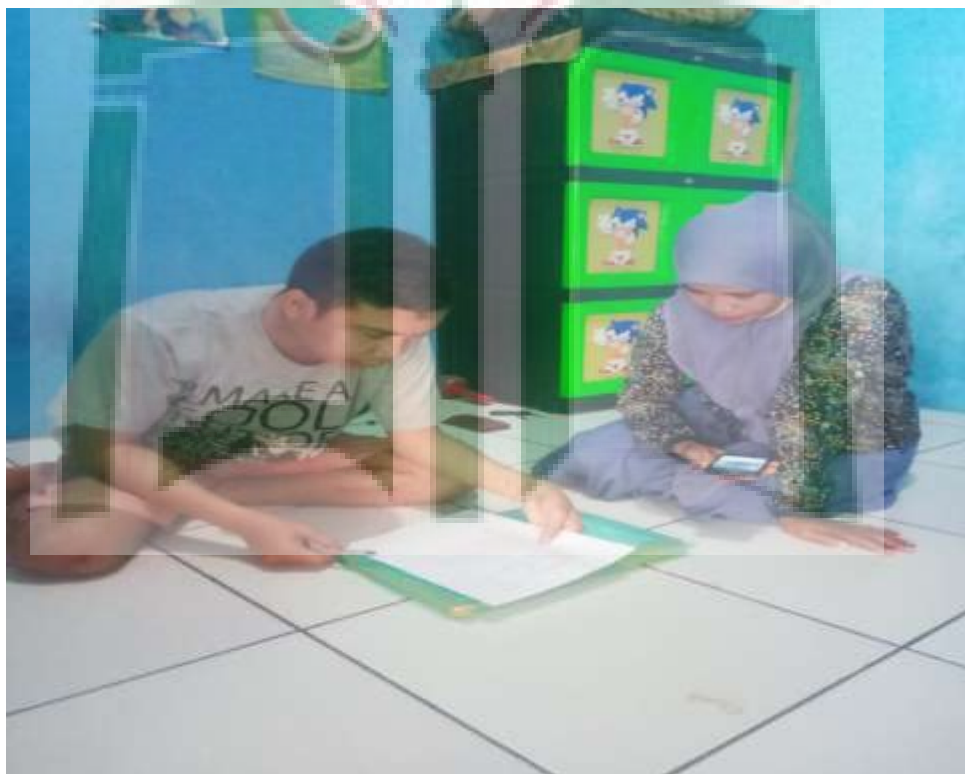
Foto 5. wawancara dengan masyarakat jambil hatumena