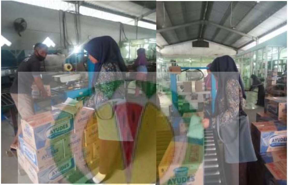
Foto 3. dan 4. Aktifitas Produksi Di CV. Abadi Tiga Mandiri