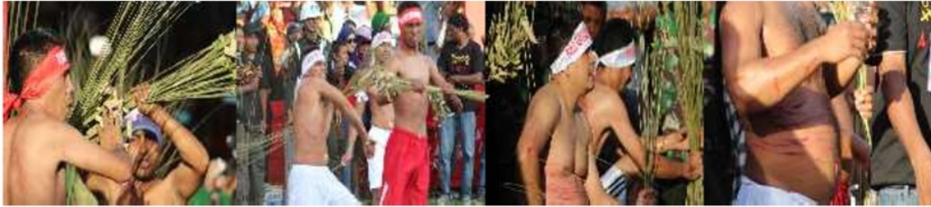
Gambar 1. Komunikasi Ritual Bakupukul Manyapu Masyarakat Mamala