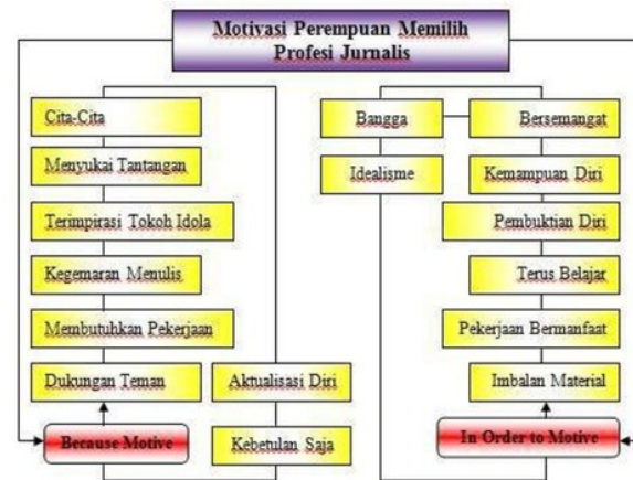
Gambar 3 Model Motivasi Jurnalis Perempuan Memilih Profesi Jurnalis

Kecenderungan yang mendorong perempuan untuk mengambil tindakan memilih pekerjaan jurnalis dapat dilihat dari motif yang mereka miliki. Motif merupakan konfigurasi atau konteks makna yang ada pada diri individu sebagai landasan dalam bertindak dan upayanya mendefinisikan diri dan lingkungan. Atau dengan kata lain, motif adalah faktor pendorong individu untuk bertindak terhadap suatu objek. Hal ini sesuai dengan pernyataan Schutz bahwa "... Motive is meaningful ground of his behavior." 31 Artinya perempuan memilih pekerjaan jurnalis peliputan lapangan dilandasi oleh motif tertentu. Dengan mengamati motif subjek dapat diketahui kecenderungan mereka