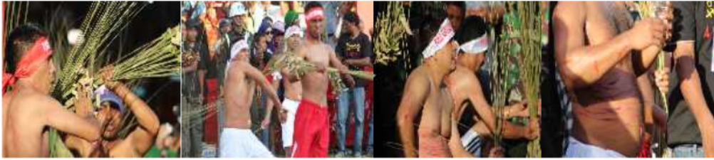
Gambar 1. Komunikasi Ritual Bakupukul Manyapu Masyarakat Mamala