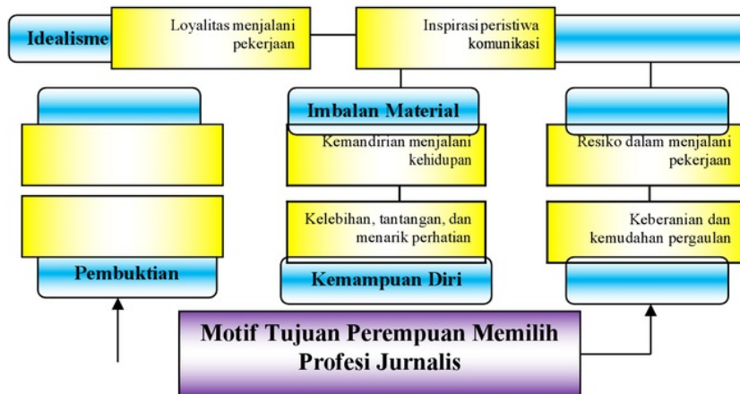
Gambar 2 Model Motif Tujuan Perempuan Memilih Profesi Jurnalis

Pengetahuan tidak serta-merta ada di dalam diri individu. Pengetahuan dihasilkan dari interaksi yang melibatkan proses berbagi informasi antara individu dengan lingkungannya. Pengetahuan itu pula lah yang melandasi terbentuknya motif untuk menjadi jurnalis. Dengan kata lain, proses pembentukan motif di dalam diri jurnalis perempuan saat mereka memutuskan memilih pekerjaan jurnalis peliputan berita lapangan, didasari oleh pengetahuan dan menimbulkan ekspektasi untuk mewujudkan suatu aktivitas tertentu, bisa dikategorisasikan ke dalam kelompok “ motive in-order-to. ”