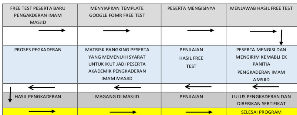
Gambar 2. Alur kerja pengkaderan Imam pada Masjid Imam Rijali IAIN Ambon

Kegiatan ini dilakukan dalam tiga tahapan yakni tahapan pra kegiatan, proses pelaksanaan kegiatan dan pasca kegiatan. Awal mula kegiatan pengkaderan Imam Masjid dengan wawasan dakwah kebangsaan ini dilakukan dengan rapat seluruh stakeholder, Lembaga IPIM dan Ta'mir Masjid Imam Rijali untuk merumuskan dan menyusun kegiatan pembukaan yang dilakukan pada tanggal 20 Januari 2020. Setelah itu pembuatan jadwal kepada peserta dan fasilitator serta narasumber. Dari jadwal ini kita bangun komitmen bersama untuk mencapai visi dan misi masjid yang memiliki wawasan dakwah kebangsaan. Dari kegiatan pengkaderan imam masjid yang memiliki wawasan dakwah kebangsaan. Berikut alur kerja pengkaderan Imam pada Masjid Imam Rijali IAIN Ambon (Gambar 2).