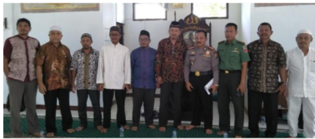
Gambar 1. Penguatan Dakwah Kebangsaan

Pelaksanaan dialog untuk pembinaan ideologi rohani kebangsaan di Masjid Imam Rijali sebagai masjid akademik adalah upaya meningkatkan peran dan fungsi masjid sebagai pusat edukasi rohani bangsa tidak diperbaiki dengan melakukan kajian-kajian maka berpotensi hadirkan krisis nalar kebangsaan. Atas dasar inilah sehingga kegiatan-kegiatan ta'mir masjid membuat seminar dan dialog dakwah kebangsaan. Hal ini juga relevan dengan kajian Zainur untuk penguatan ideologi ekonomi Islam di masjid untuk memperkokoh wawasan kebangsaan dengan cara Pengabdian kepada Masyarakat melalui penguatan ekonomi masjid sebagai penyangga umat (Zainur, 2020). Pemikiran ini sangat relevan dengan hasil temuan Zulkarnain yang menawarkan model kewirausahaan di masjid demi peningkatan kualitas pelayanan masjid (Mora et al., 2020). Ketika infaq masjid dapat digunakan untuk kebutuhan berjamaah maka 40 rumah di sekitar masjid tidak ada yang kumuh. Selain itu penguatan kapasitas Imam masjid juga dapat dikembangkan sebagai visi dan misi besar masjid untuk penguatan dakwah kebangsaan.