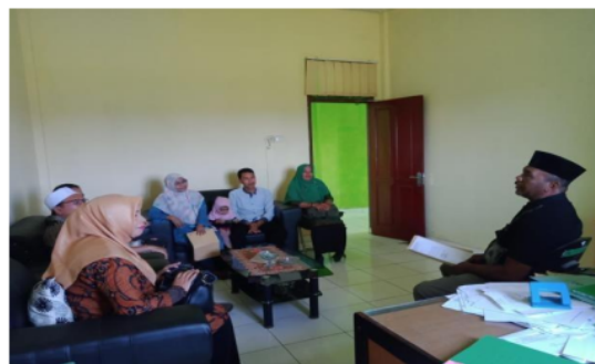
Gambar 2. Audiensi Pihak Kemenang Halmahera Utara