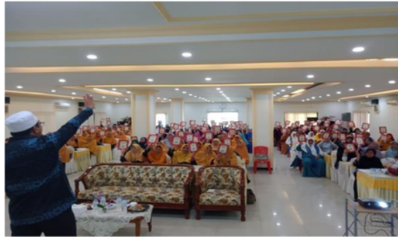
Gambar 4. Training of Tutor Method Qiro'ah di Aula Hotel Geenland Kota Tobelo

Pendampingan melalui Training of Tutor Method Qiro'ah terfokus pada bagaimana memberikan pemahaman kepada partisipan mengenai cara mengajar mengaji melalui penggunaan metode qiro'ah, bukan mengajari partisipan mengaji. Partisipan sebagai peserta pendampingan harus memenuhi persyaratan awal dengan fasih membaca Al-Qur'an. Realitasnya, partisipan sebagian besar belum menguasai dengan baik makharjul huruf sebagai pengetahuan awal dalam belajar mengaji. Materi training disajikan dengan inovatif dan menyenangkan dengan durasi waktu satu hari (10 jam pembelajaran).