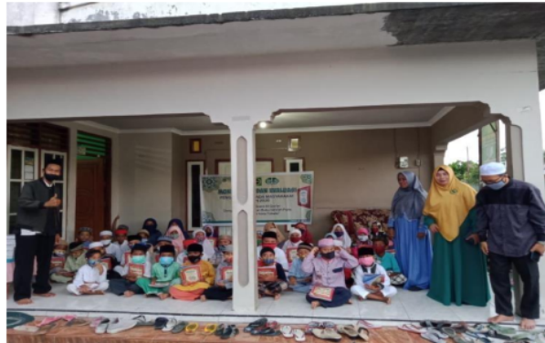
Gambar 6. TPQ Binaan Majelis Taklim Menggunakan Metode Qiro'ah

rencana lanjutan pembinaan majelis taklim secara berkala dari penguatan aksara Al-Qur'an yang telah dilakukan.