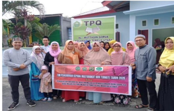
Gambar 3. Observasi TPQ Binaan Majelis Taklim Bersama Ketua BKMT Halmahera Utara

memudahkan melakukan pendampingan sebagai pembinaan. Tim pendampingan melakukan pengabdian untuk menghasilkan majelis taklim memiliki kemampuan membaca Al-Qur'an