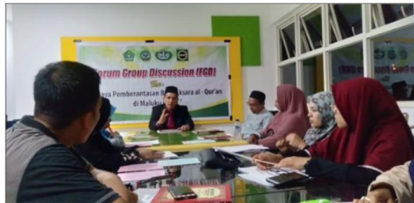
Gambar 1. Focus Group Discussion Tahapan Ke-1