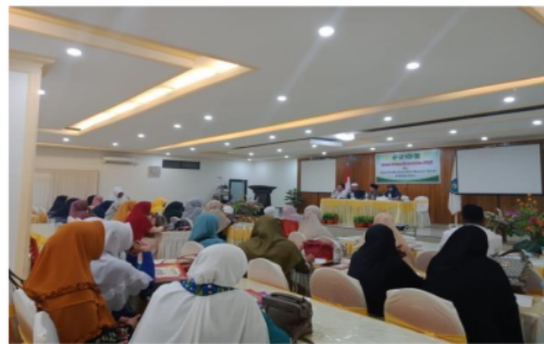
Gambar 5. Fokus Group Discussion Tahapan Ke-2 di Aula Hotel Geenland Kota Tobelo