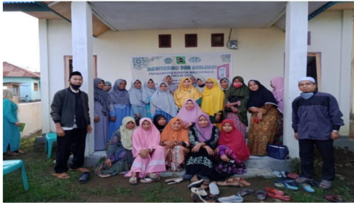
Gambar 7. Monitoring Kegiatan Majelis Taklim di Kota Tobelo

memahami. Kemudian Group WhatsApp bermanfaat dalam rangka berbagi motivasi kepada masing-masing objek abdi dengan memperlihatkan progres kegiatan. Grup WhatsApp dibuat setelah kegiatan TOT Qiro'ah di awal Maret 2020, dan aktif hingga kegiatan pengabdian selesai, yang menandakan bahwa kegiatan kontroling oleh objek abdi terus berjalan. Kedua, Monitoring langsung di lapangan yang dilaksanakan di bulan Juli 2020, karena menunggu pelonggaran pembatasan sosial. Tim pengabdian berusaha menjangkau semua majelis taklim binaan objek abdi untuk mengetahui bagaimana perkembangan kegiatan penguatan aksara Al-Qur'an. Di lapangan, tim menemukan bahwa buku qiro'ah telah dipakai di sebagian besar majelis taklim yang ada di Kota Tobelo, termasuk TPQ, komunitas muallaf, maupun di sekolah.