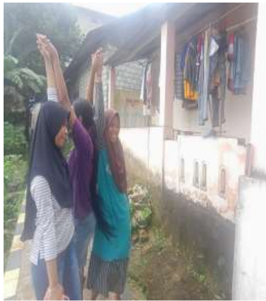
Gambar 1. Perilaku Anak-Anak Bermain Aplikasi Tik Tok