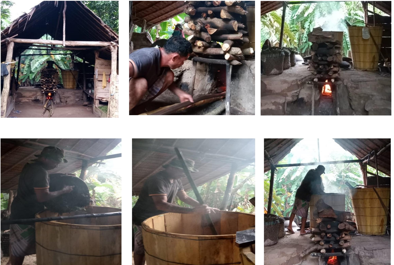
Gambar 2. Rumah ketel dan proses pemasakan minyak kayu putih