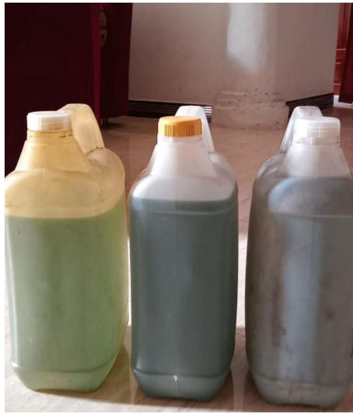
Gambar 7. Dokumentasi minyak kayu putih