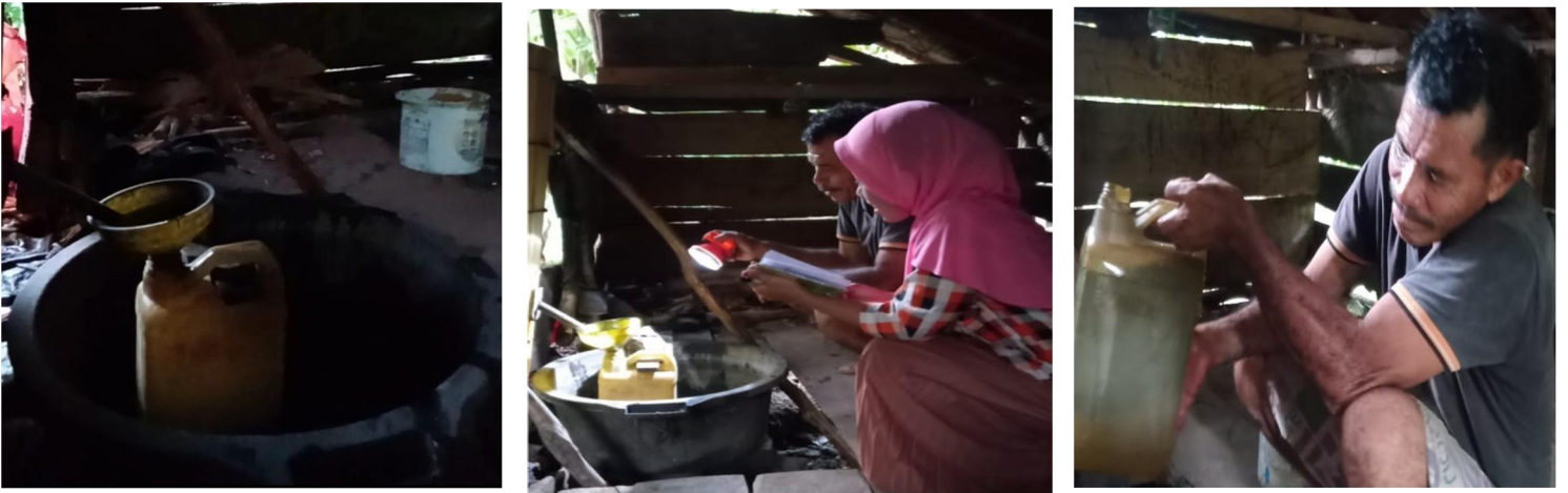
Gambar 3. minyak yang dihasilkan