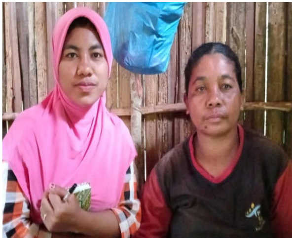
Gambar 6. Wawancara dengan konsumen akhir