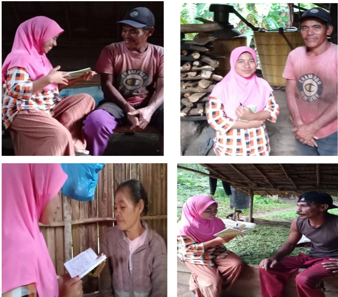
Gambar 4. Wawancara dengan pelaku usaha pengelola minyak kayu putih