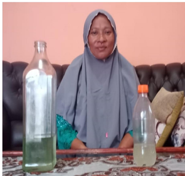
Gambar 5. Wawancara dengan pelaku usaha (konsumen antara)