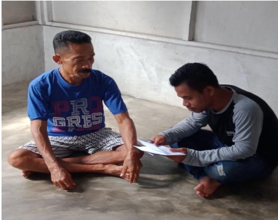
Gambar 3 : Wawancara dengan anak Negeri Said Umasugi