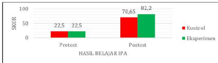
Gambar 1. Skor IPA

Hasil pretest dan posttest kedua kelompok berupa skor tampak dalam Tabel 2. Dari tabel yang ada terungkap rata-rata skor tes awal ( pretest ) kelompok eksperimen adalah 22,50 dengan standar deviasi sebesar 6,38 dan skor tes akhir ( posttest ) sebesar 82,20 dengan standar deviasi yakni 14,94. Sementara rata-rata skor tes awal kelompok kontrol yakni 22,50 dan memiliki standar deviasi sebesar 5,98, selanjutnya skor tes akhir sebesar 70,65 dengan standar deviasi adalah 10,38. Dari Tabel 3 diperoleh informasi. Kategorisasi skor tes awal pada kelompok kontrol dan eksperimen adalah sama. Tiap-tiap kelompok awalnya gagal. Namun setelah dilakukannya pembelajaran terjadi perubahan skor pada masing-masing kelompok. Perubahan ini tampak pada kategorisasi skor tes akhir.