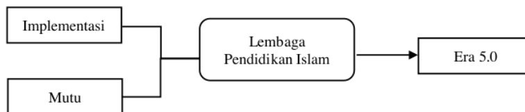
Gambar 1. Skema Hasil Penelitian

Untuk memaparkan hasil penelitian, terlebih dahulu akan dibuat skema atau alur pemetaan dari proses penelitian yang dilakukan. Adapun skemanya adalah sebagai berikut.