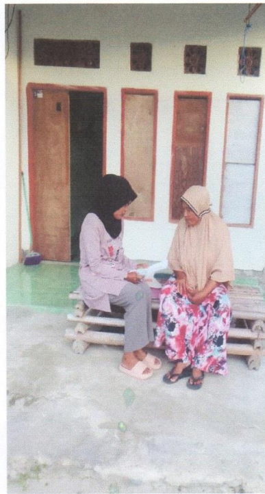
Gambar 5 Wawancara Masyarakat