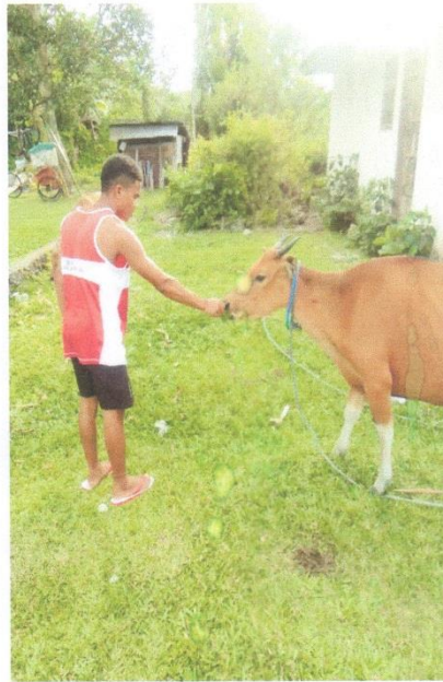
Gambar 1. Wawancara dengan Peternak Sapi