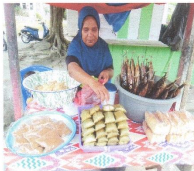
Gambar 4 Wawancara Masyarakat