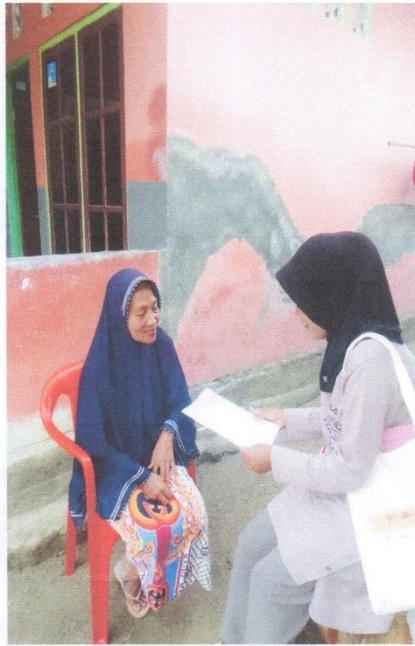
Gambar 3 Wawancara Masyarakat