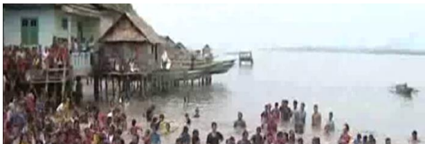
Dokumentasi Perjalan darat melewati Lautan, Dan Di Hadang Oleh Marawang