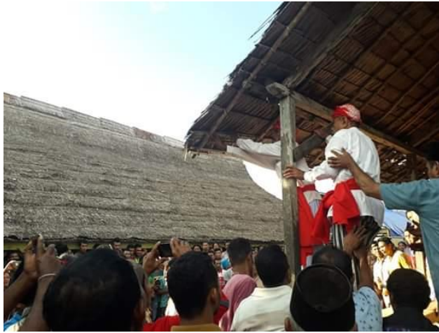
Dokumentasi Kapala Datti Memimpin Rombongan Kehutan