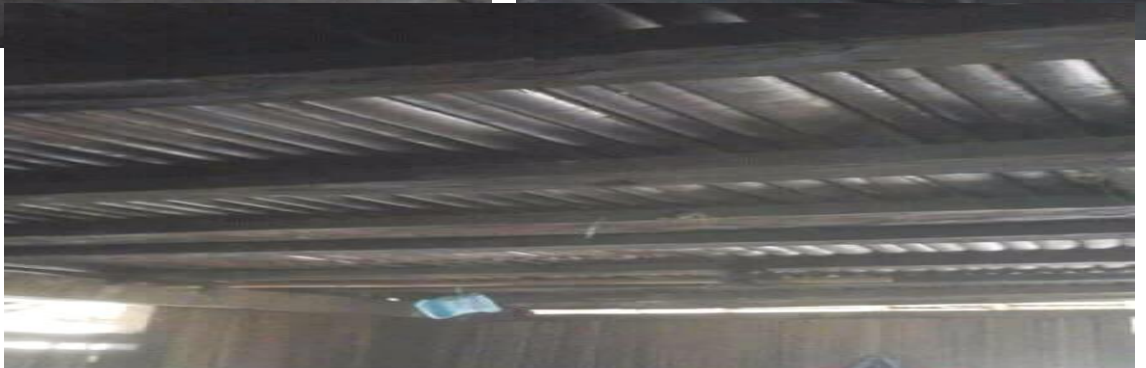
Para –Para atau Rarihahai (Palpon)