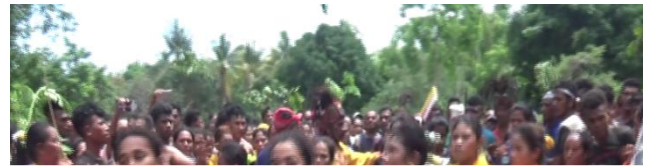
Dokumentasi Totaritas Adat Membuat Pata NYAI KERASUKAN