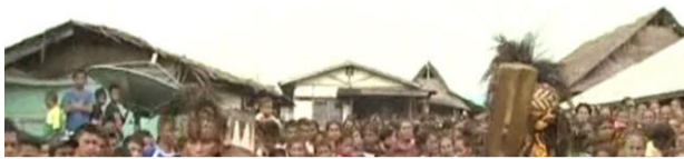
Dokumentasi Dua Orang Tete Parang