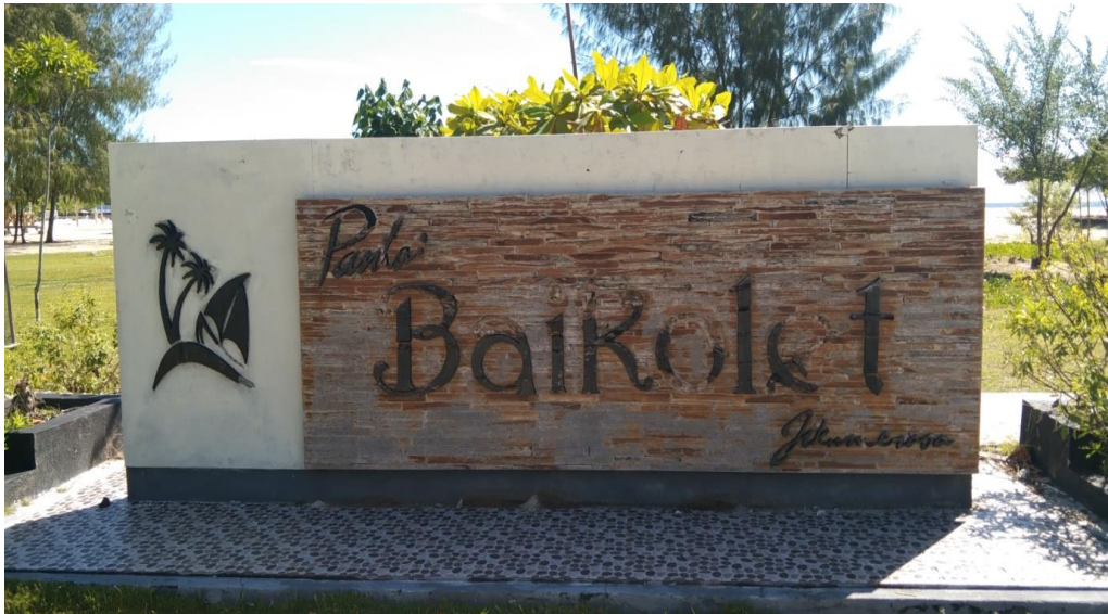
Gambar 2. Tempat Wisata Pantai Baikolek Desa Jikumerasa