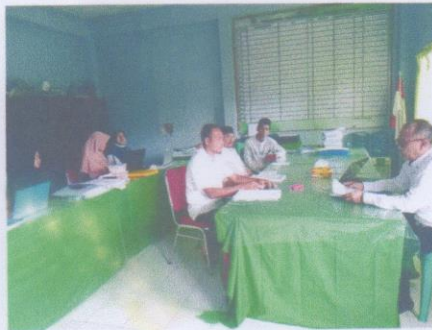
Pengawas Sekolah Dalam Mengevaluasi Kinerja Guru