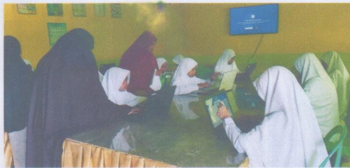
Guru Memberikan Pengarahan