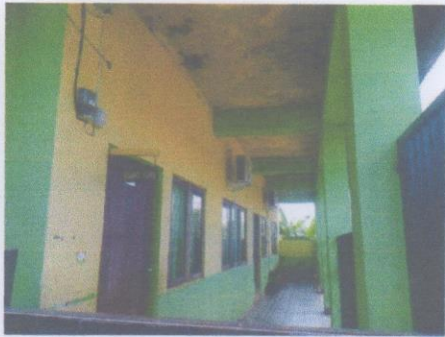
Bangunan Gedung Sekolah