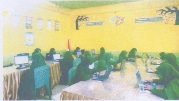
Ujian Al-Quran dan Hadist