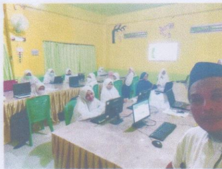
Kepala Sekolah Turut Mengawasi Proses Pengajaran