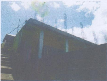
Bangunan Gedung Sekolah