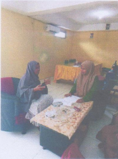
Wawancara Dengan Guru