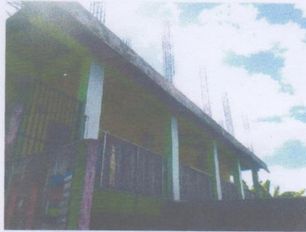
Bangunan Gedung Sekolah