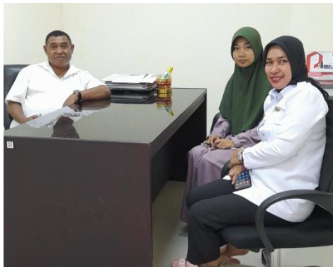
Gambar 2 Wawancara dengan Kepala Dinas Koperasi dan UKM Kota Ambon