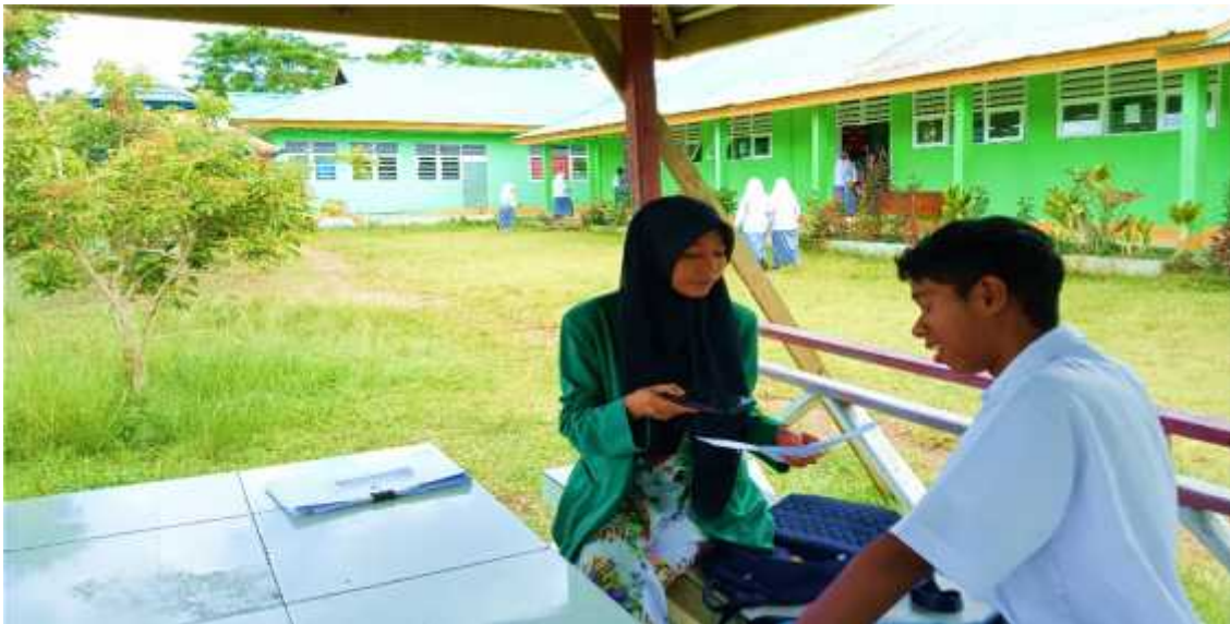
Foto 2. Suasana saat peneliti melakukan wawancara dengan peserta didik Kaisar Abdullah