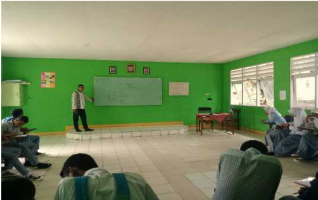
Foto 1. Suasana saat peneliti melakukan observasi kepada guru akidah akhlak dalam kelas X IPS 1