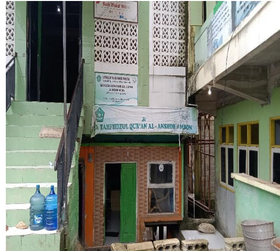
Gambar 2. Alamat MA Tahfidzul Qur'an