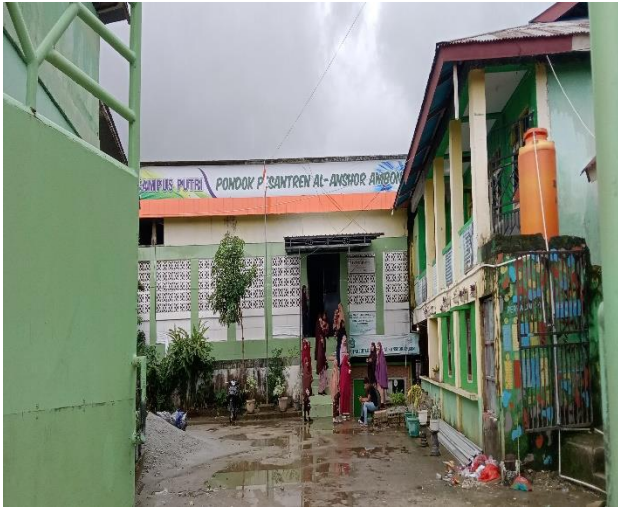
Gambar 1. MA Tahfidzul Qur'an Al-Anshor Ambon