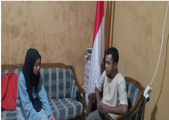
Gambar 3. Wawancara dengan kepala MA Tahfidzul Qur'an Al-anshor Ambon