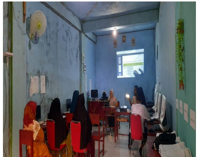
Gambar 16. Rapat Kerja Tahunan (RKT)