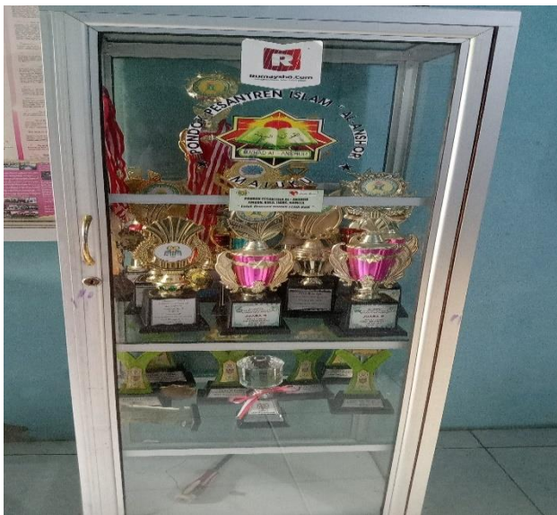
Gambar 19. Penghargaan piala dan medali yang diikuti peserta didik dengan berbagai mata lomba