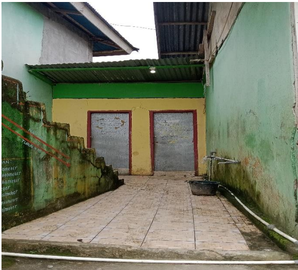
Gambar 15. WC