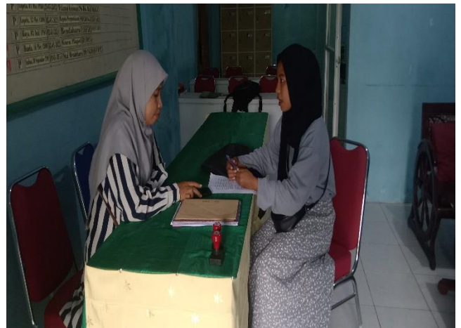
Gambar 4. Wawancara dengan Wakamad Kurikulum