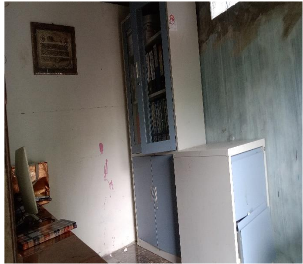
Gambar 14. Ruangan TU