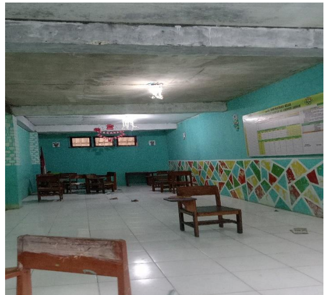
Gambar 20. Kondisi Ruang k