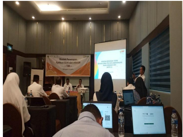
Gambar 1.8 Pelaksanaan pembinaan EDM dan Erkam kepada guru-guru