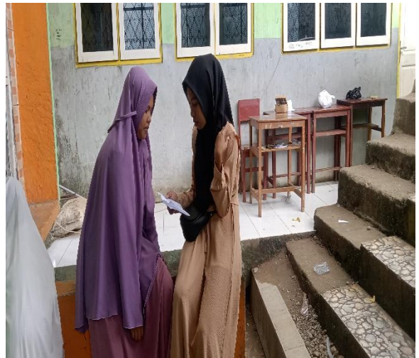
Wawancara dengan Guru PAI