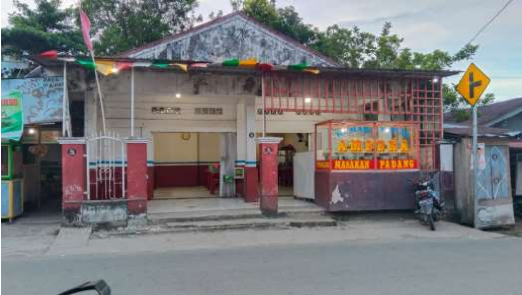
Gambar 1. Rumah Makan Ayah kompleks IAIN