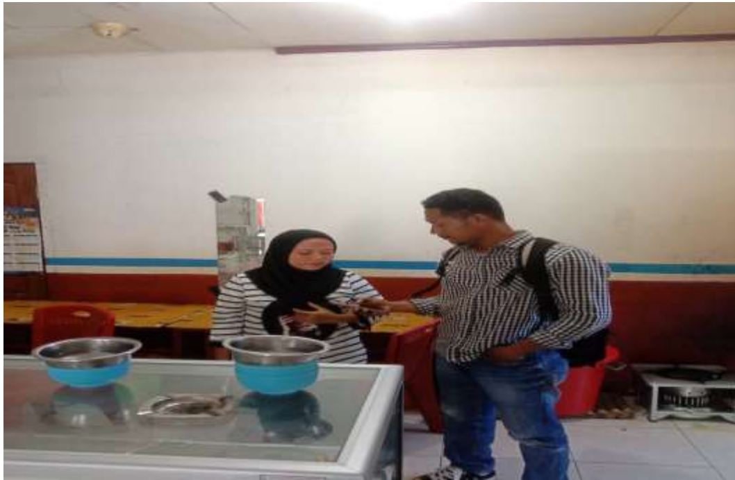
Gambar 3. Konsumen rumah makan ayah