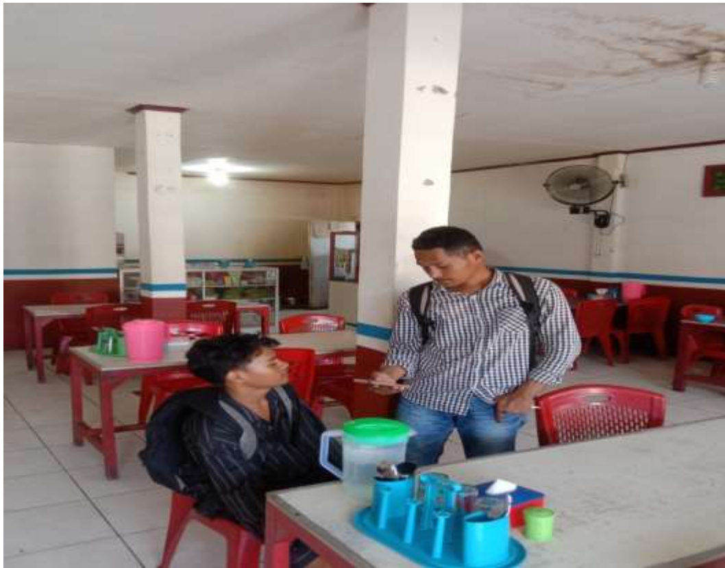
Gambar 5. Konsumen rumah makan ayah