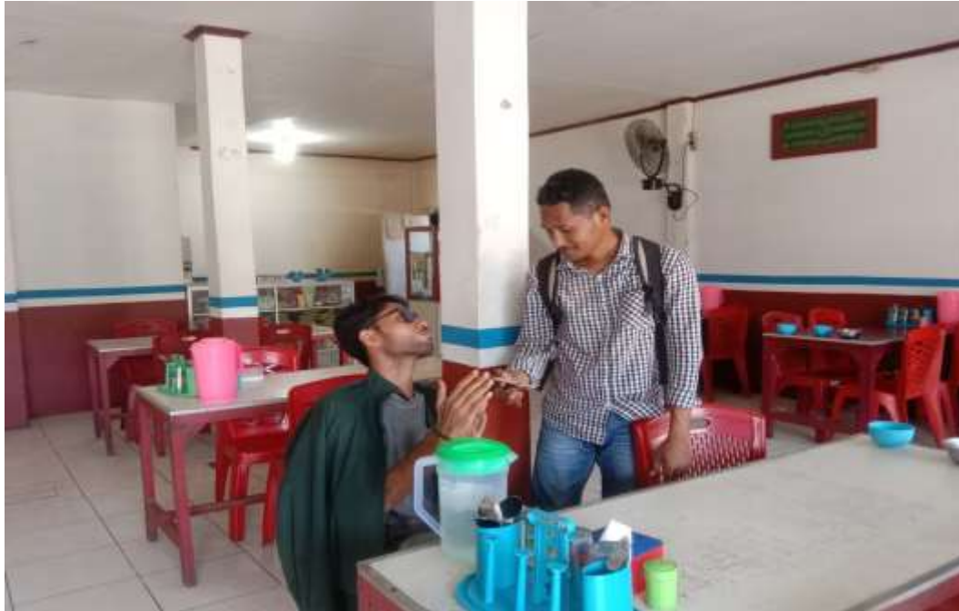
Gambar 4. Konsumen rumah makan ayah