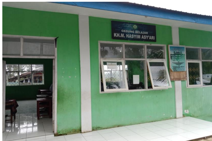
Gambar 5. Ruang Kelas MTs Hasyim Asy'ari Ambon