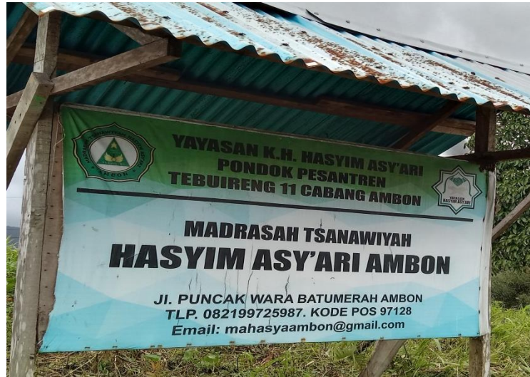
Gambar.4 Papan Nama MTs Hasyim Asy'ari Ambon