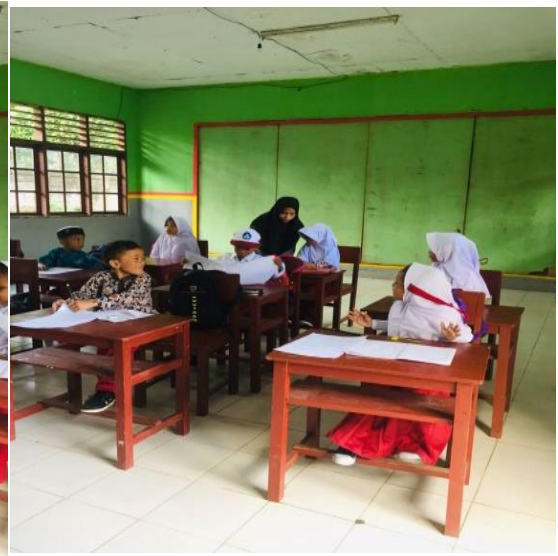
Gambar 3: Membagikan Angket Untuk Semua Peserta Didik Kelas 1