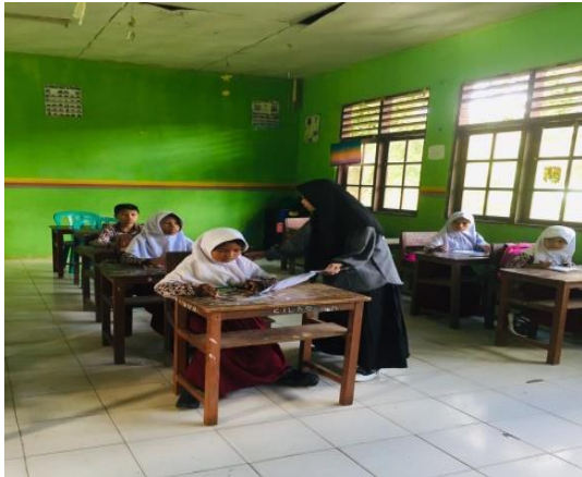
Gambar 6: Pembagian Angket Kelas 3