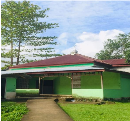
Gambar 18: Mushollah MIS Almadinah