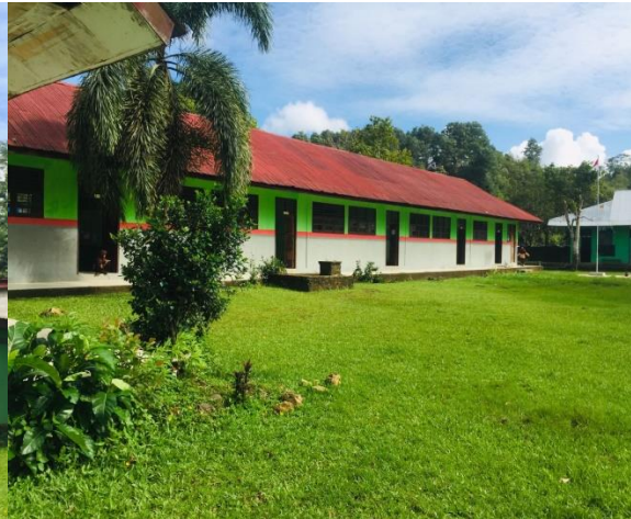
Gambar 19: Halaman MIS Almadinah