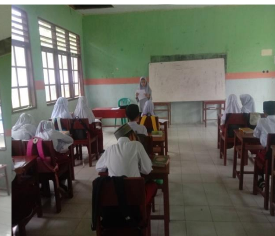
Gambar 11: Menjelaskan Petunjuk Pengisian Angket di Kelas 5 dan 6