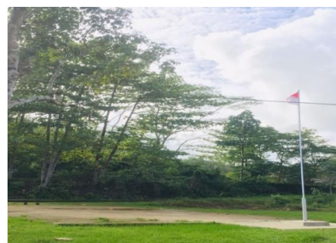
Gambar 17: Halaman Upacara /Apel pagi MIS Almadinah