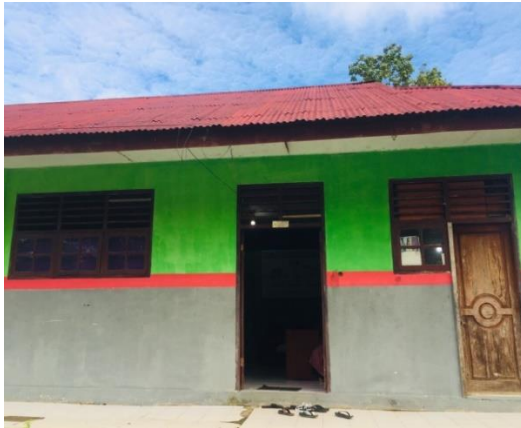
Gambar 12: Kantor MIS Almadinah