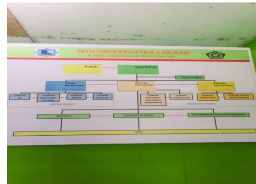
Gambar 15: Struktur MIS Almadinah