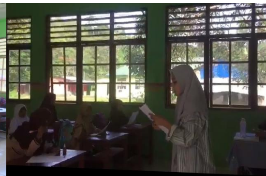
Gambar 9: Menjelaskan Pengisian Angket Kelas 4