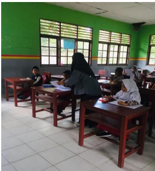
Gambar 4: Pembagian Angket Di Kelas 2