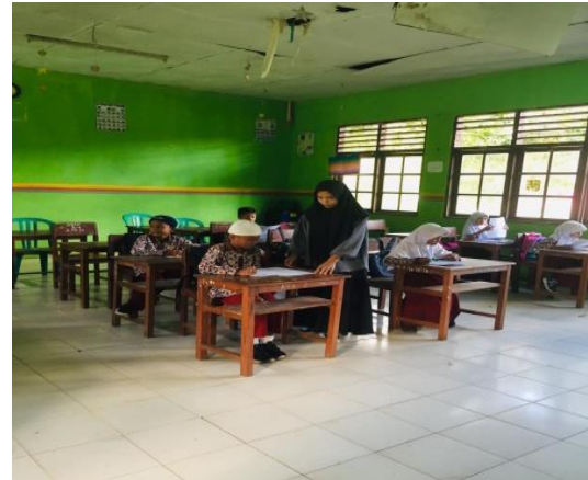
Gambar 7: Pengisian Angket Kelas 3