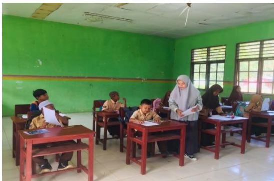
Gambar 8: Pembagian Angket di Kelas 4