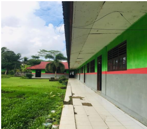
Gambar 20: Ruang 1 Sampai kelas 6