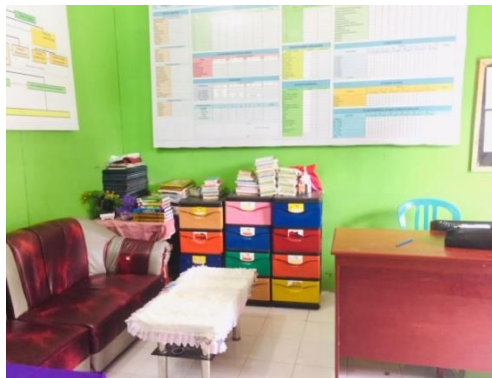
Gambar 14: Ruang Tamu MIS Almadinah