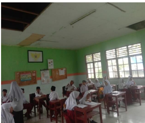
Gambar 10: Pembagian Angket Kelas 5 dan 6