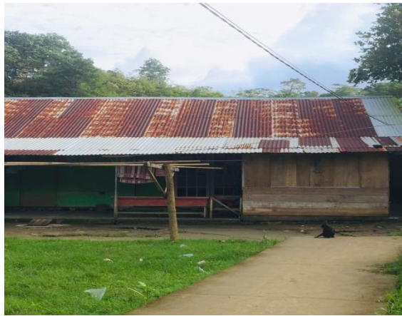
Gambar 21: Kantin MIS Almadinah