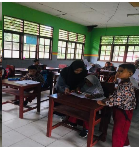
Gambar 5: Melakukan Pengisian Angket Kelas 2