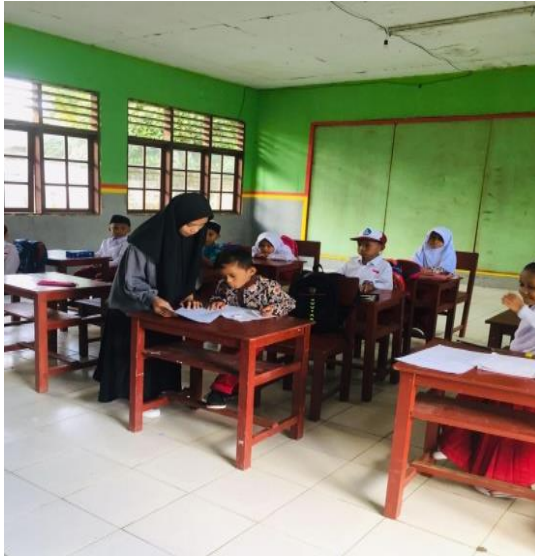
Gambar 2: Menjelaskan Pengisian Angket Di Kelas 1