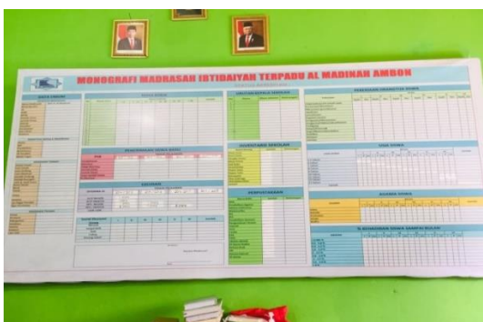
Gambar 16: Monografi MIS Almadinah