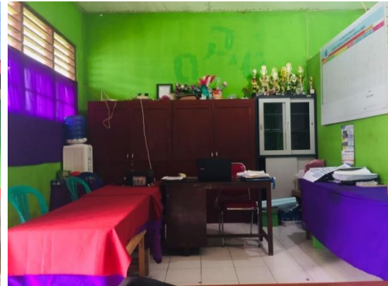
Gambar 13: Ruang Guru Beserta Ruang Kepala Madrasah MIS Almadinah