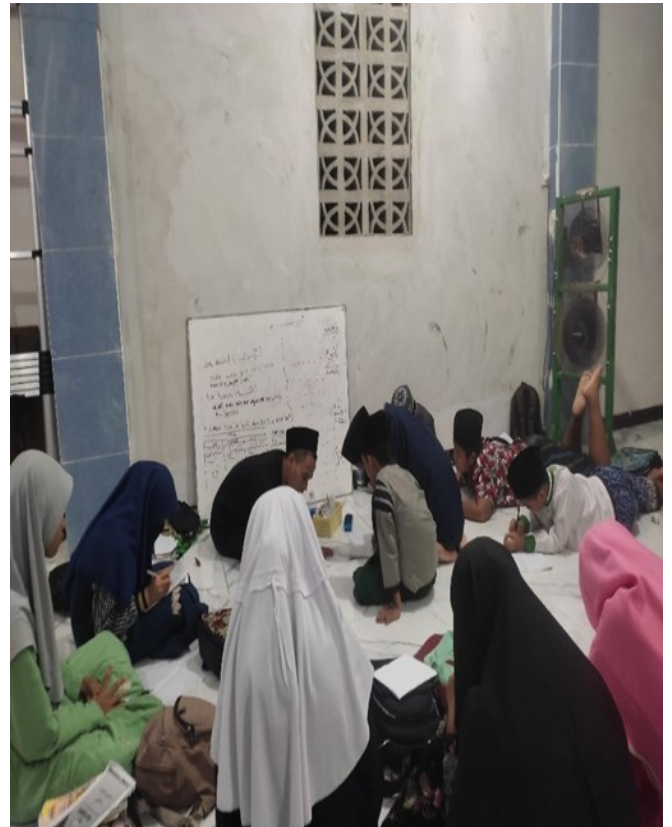
Pelaksanaan menggunakan metode An-Nahdliyah dan Wawancara dengan Santri TPQ Al-Ikhlash