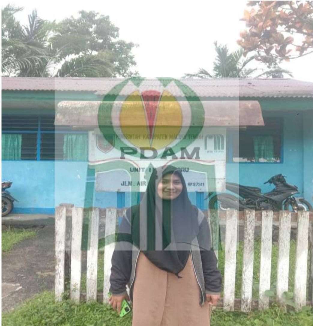
Lokasi Depan Perusahaan Daerah Air Minum Desa Tehoru