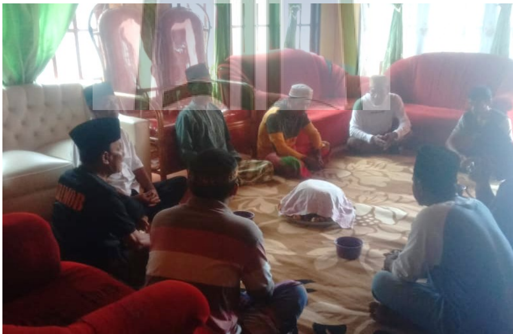
Foto 8. Pelaksanaan tahlilan di Dusun Ely Besar Kabupaten Seram Bagian Barat