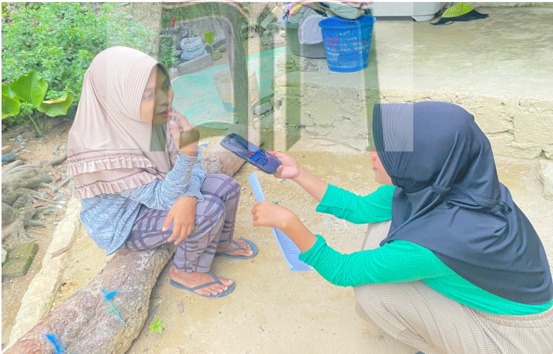
Gambar 1.12 Wawancara bersama Masyarakat Kebun Cengkeh Desa Batu Merah.