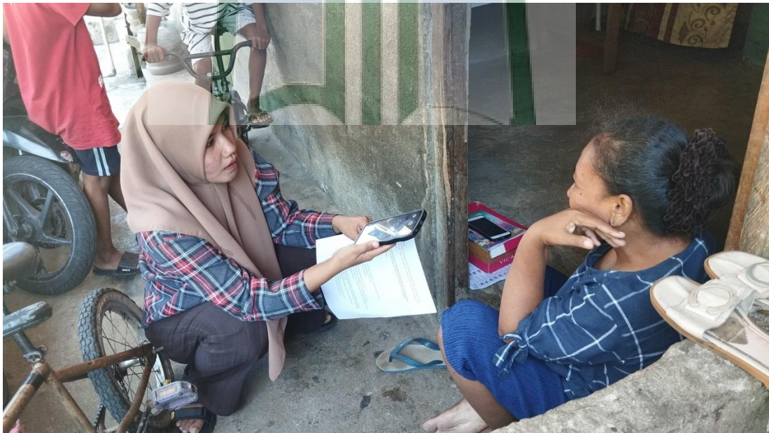
Gambar 1.8. Wawancara bersama Masyarakat Desa Batu Merah Dalam.