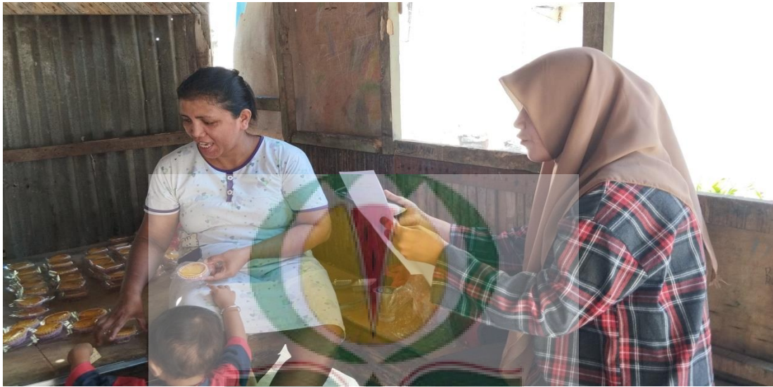
Gambar 1.7 Wawancara bersama Masyarakat Desa Batu Merah Dalam.