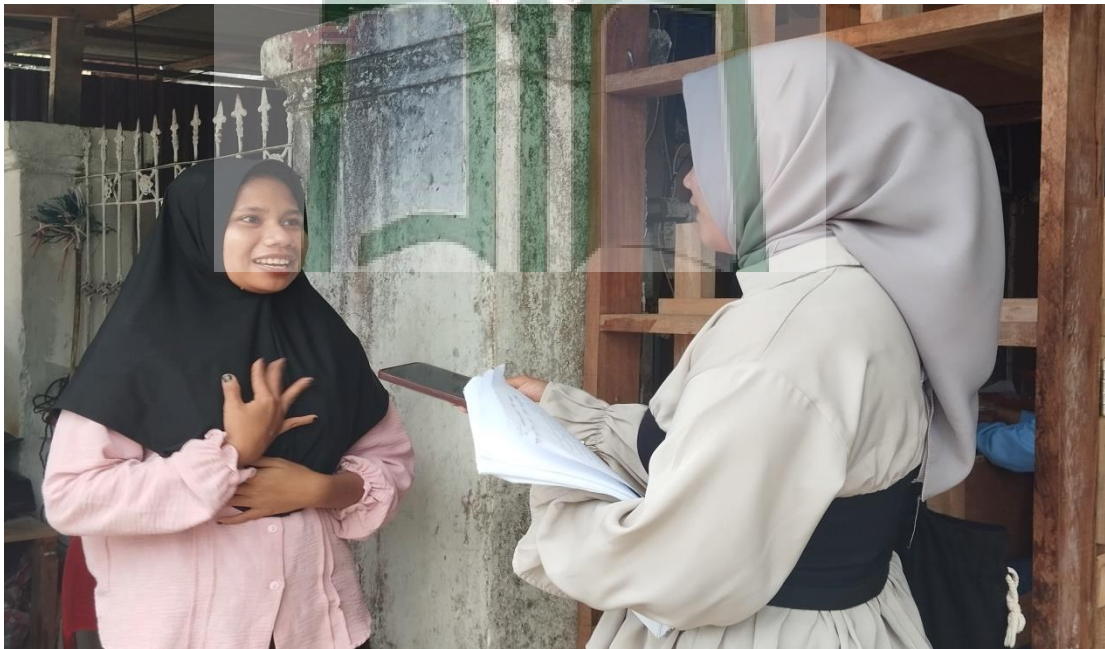
Gambar 1.16 Wawancara bersama Masyarakat Kahena Desa Batu Merah.