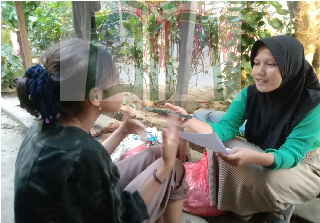
Gambar 1.10 Wawancara bersama Masyarakat Kebun Cengkeh Desa Batu Merah.