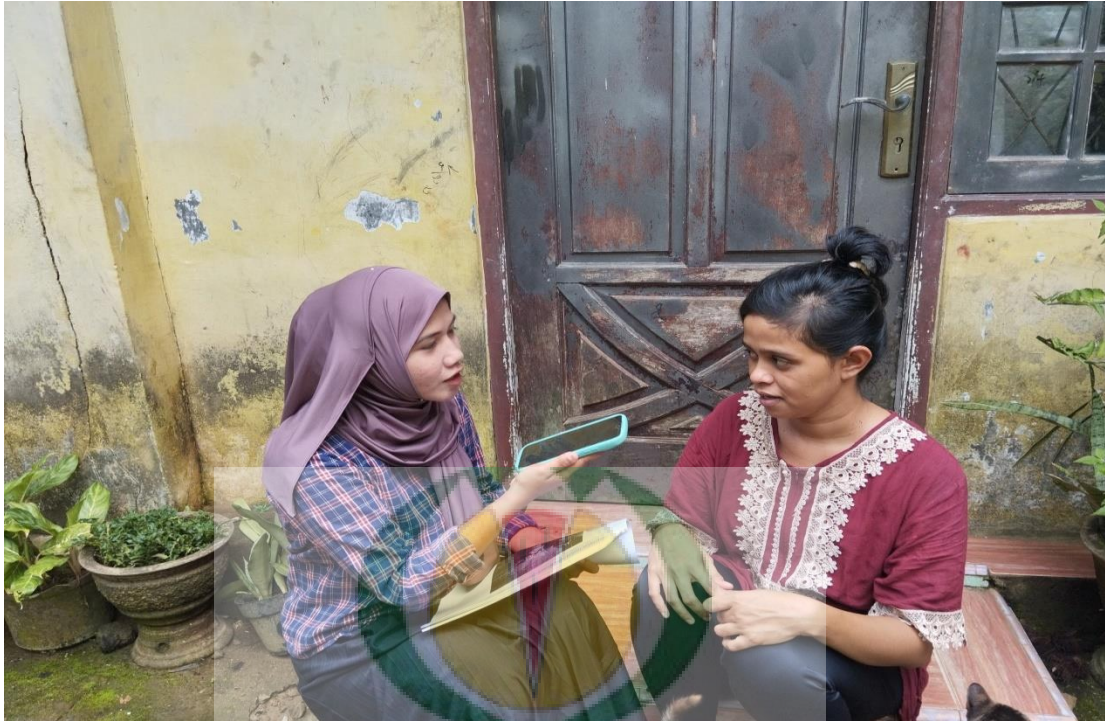
Gambar 1.13 Wawancara bersama Masyarakat Kahena Desa Batu Merah.