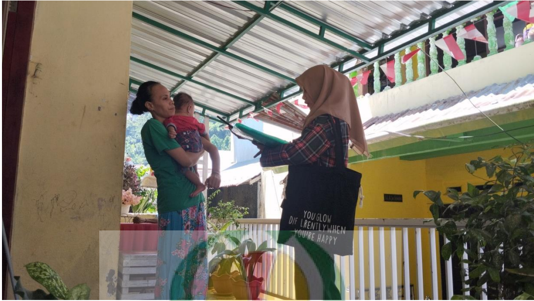
Gambar 1.9 Wawancara bersama Masyarakat Desa Batu Merah Dalam.