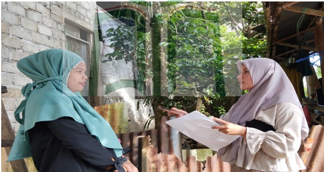
Gambar 1.18 Wawancara bersama Masyarakat Kebun Cengkeh Desa Batu Merah.