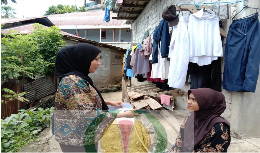
Gambar 1.11 Wawancara bersama Masyarakat Kebun Cengkeh Desa Batu Merah.