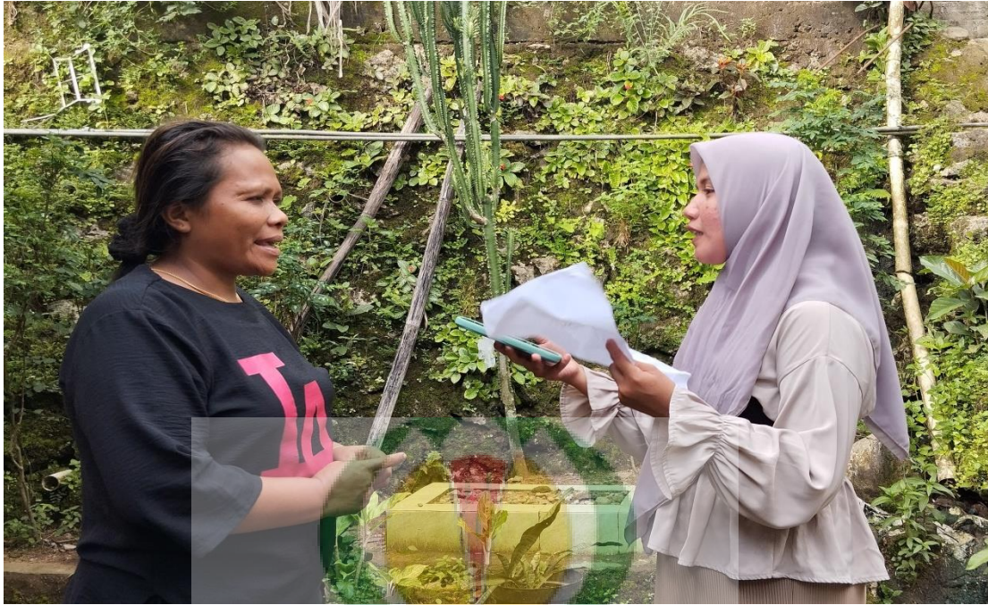
Gambar 1.15 Wawancara bersama Masyarakat Kahena Desa Batu Merah.