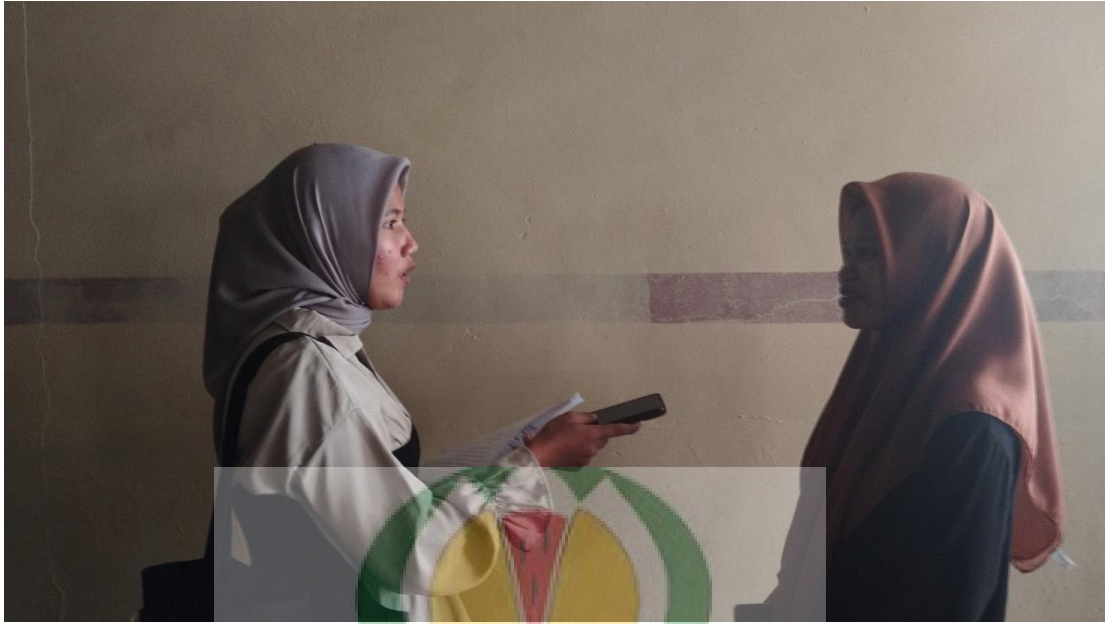
Gambar 1.17 Wawancara bersama Masyarakat Stain Desa Batu Merah.