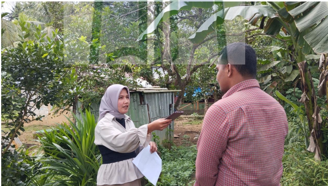
Gambar 1.14 Wawancara bersama Masyarakat Stain Desa Batu Merah.