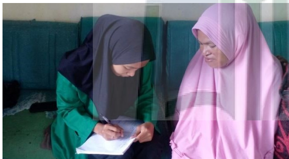
Gambar 1.4 : Sauda