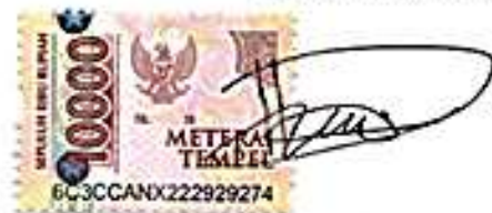
Yuniarti Mauliddinah Hulihulis

Ambon, 15 September 2025 Yang menyatakan,