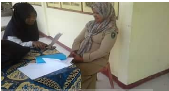
Foto 4. Wawancara dengan wali kelas