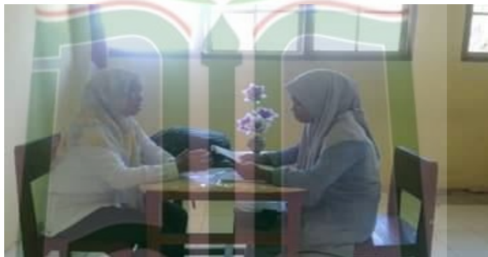
Foto 2. Wawancara dengan guru biologi