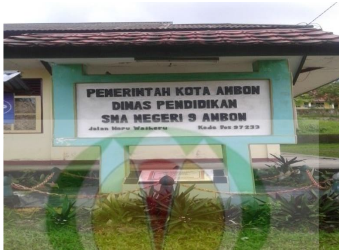
Foto 1. Papan nama sekolah SMA Negeri 9 Ambon