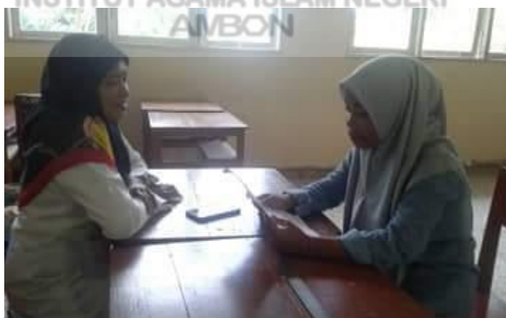
Foto 3. Wawancara dengan guru PAI